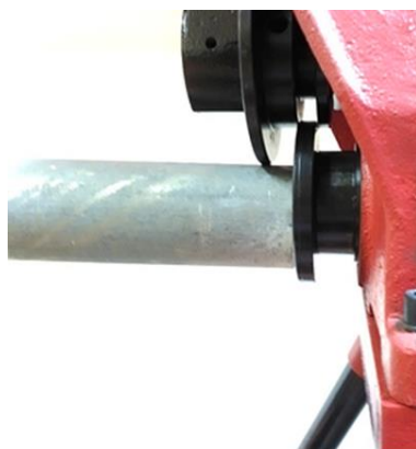
Рис. 2 Установка трубы