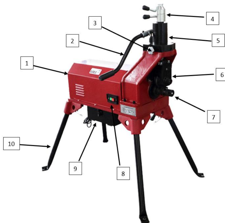
Рис. 1 Устройство желобонакатного станка

1-Станина со съемными ножками; 2-Ручка гидравлического пресса; 3-Винт перепускного клапана; 4-Винт для регулировки глубины накатки желоба; 5-Гидравлический ручной пресс для подачи накаточного ролика; 6-Накатывающий ролик; 7-Ведущий ролик; 8-Кнопка включения/выключения; 9-Бокс для хранения сменных роликов (V-Groover 12; V-Groover 1-12); 10-Опорные ножки.